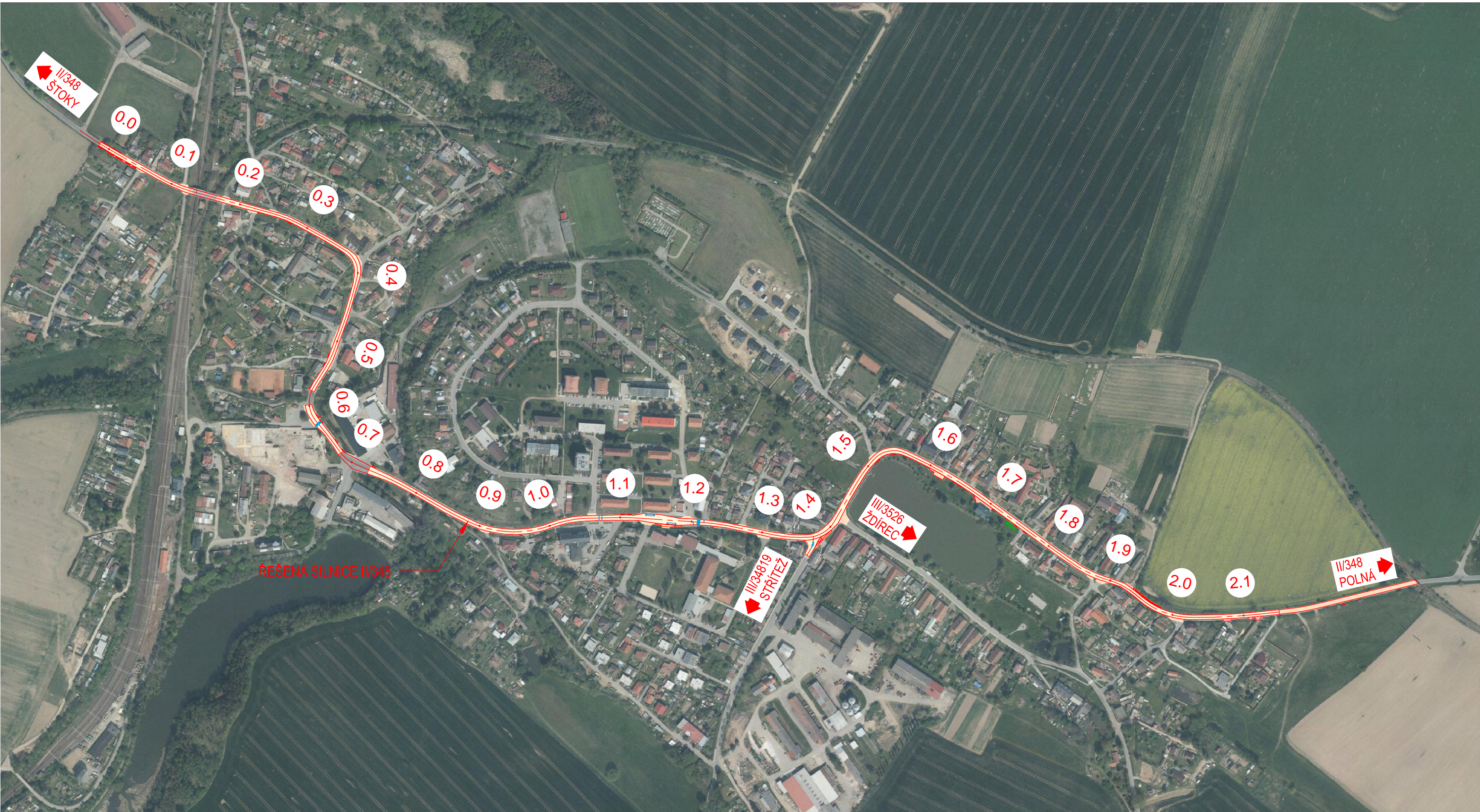
CELKOVÁ SITUACE STAVBY 1:5000